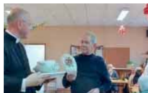
Vente à la crèche

Vente aux enchères : organisée par le Patronage Saint-Paul au profit des cinq paroisses de l'est Argentonais : Bouillé-Saint-Paul, Cersay, Massais, Saint-Pierre-à-Champ et Bouillé Loretz