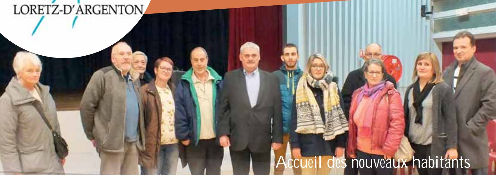
Accueil des nouveaux habitants