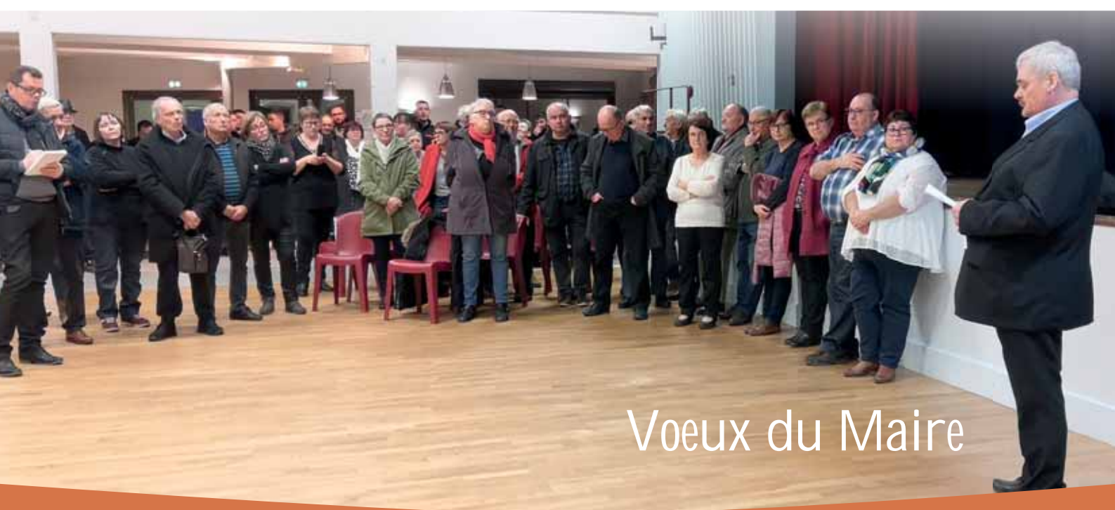
Voeux du Maire

Mairie Argenton l'Eglise : 05.49.67.02.14 Mairie Bouillé Loretz : 05.49.67.04.57