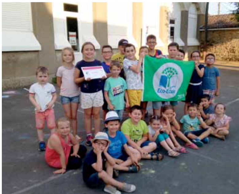
7 ème labellisation de l'école en juin 2019