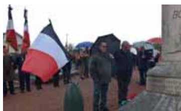
Dépôt de gerbe par la Municipalité.