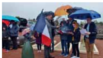
Lecture du message de l'Union fédérale par les jeunes du collège Molière