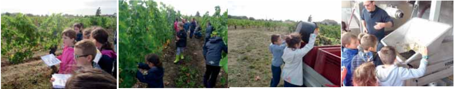
Les vendanges pour tous en octobre 2019

Multiplie les actions pour permettre aux enfants de profiter des projets pédagogiques enrichissants qui s'offrent à eux !