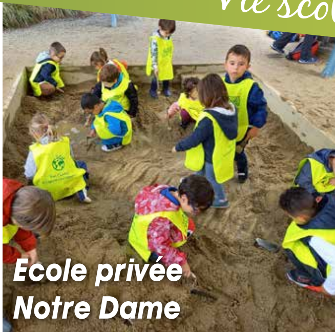
Ecole privée Notre Dame