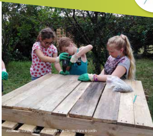
Atelier de construction du poulailler de l'école dans le jardin