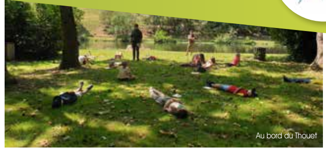
Au bord du Thouet