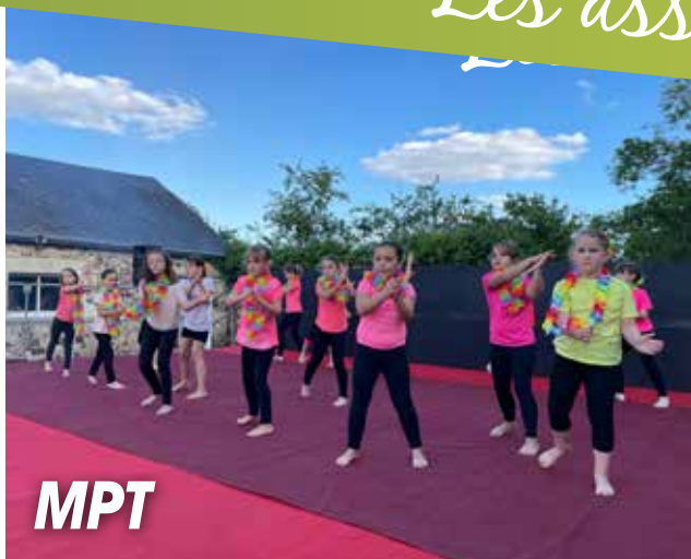
gala danse modern'jazz