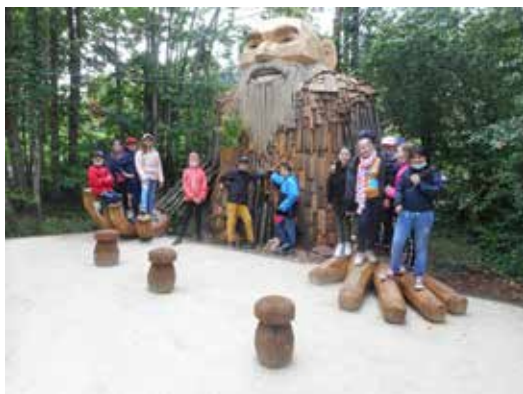
sortie scolaire à Terra Botanica

Venez découvrir notre école notre équipe et les projets pédagogiques de l'année scolaire sur notre site : http://ecolenotredamedelajoie.e-monsite.com